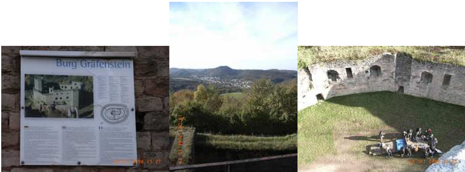
Die Burg Gräfenstein, die Aussicht vom Burgturm und die Picknicker.

Gegen 17 Uhr machten wir uns dann wieder auf dem Weg zum letzten Ziel des Tages, dem Marienhof in Flemlingen.