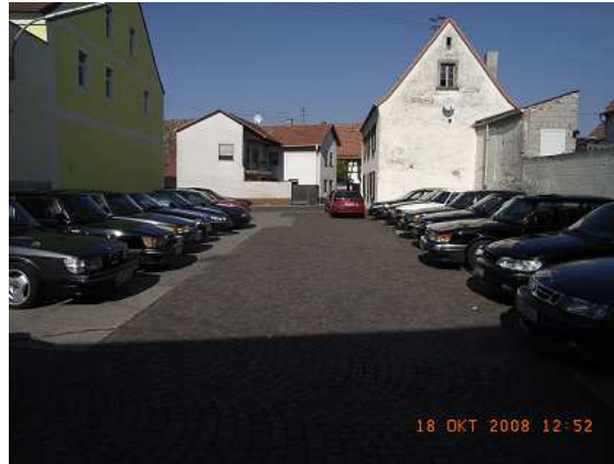
Alles muß seine Ordnung haben.

Ich glaube auch ohne Glas wird der Tag unvergesslich sein und in schöner Erinnerung bleiben.