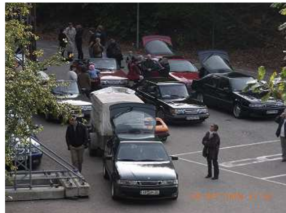
So langsam füllte sich der Parkplatz vor dem Hambacher Schloß.

Gegen 12.00 Uhr und nach kurzer Ansprache der Saabischen Hexe setzte sich der Konvoi in Bewegung.