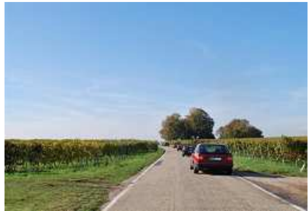
Fahrt durch den Pfälzer Wald und die Weinanbaugebiete.