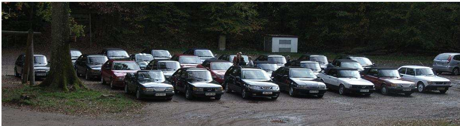
Parkplatz an der Burg Gräfenstein.