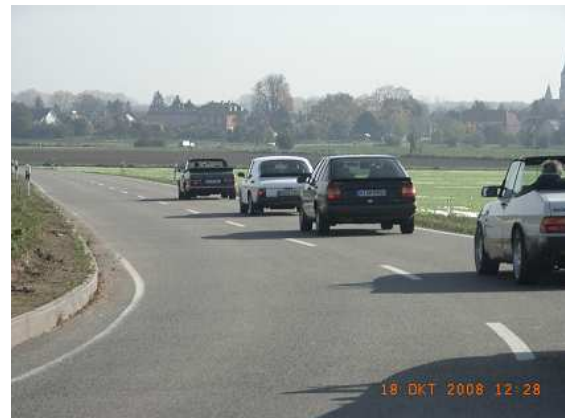
Auf dem Weg zur Schrauberhalle des Saabcommander.